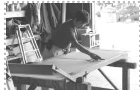
網戸張替え&包丁研ぎ