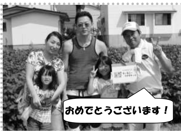
おめでとうございます！