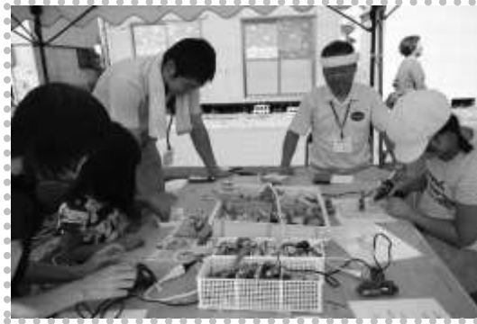
お子様たちが真剣に取り組んでいた木工クラブでは、ステキな作品がたくさんできました！