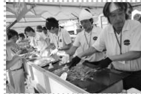
焼きそば、フランクフルト、かき氷、ポップコーン、玉コンの無料の屋台は今年も大盛況でした！