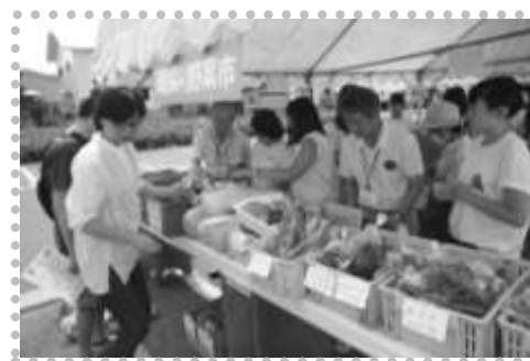
カボチャや枝豆、ナスなど旬の野菜がたくさん揃った、朝採り野菜市！