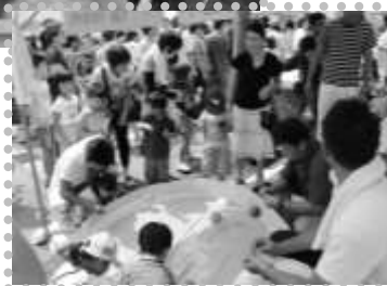
キッズコーナーの金魚すくいやヨーヨー釣りではお子様たちのたくさんの笑顔が見られました！