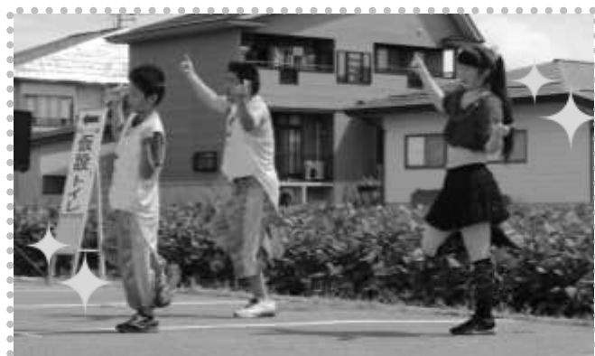
キラキラなダンスのフィットネスファミリア