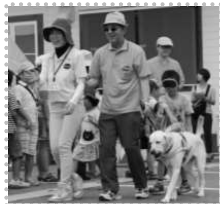
盲導犬への寄付もたくさんの方にご協力をいただきました！