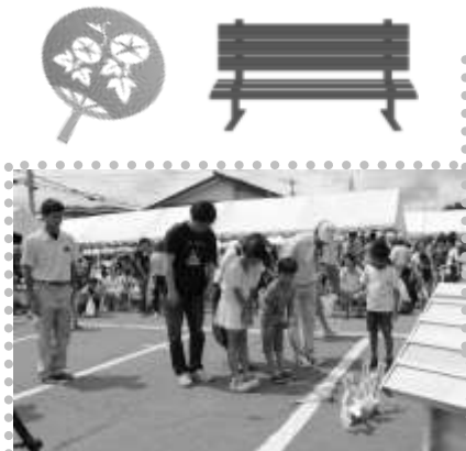
大工さんパフォーマンスでは手造りの犬小屋とベンチを製作し抽選会を行いました