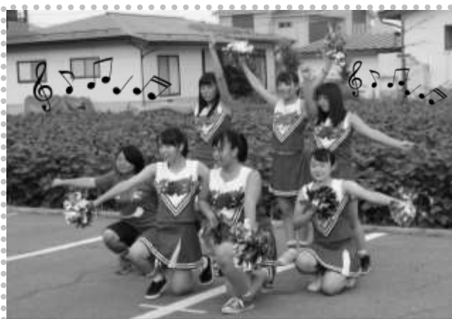
キュートなダンスで会場を盛り上げてくれた九里学園ダンス部のみなさん