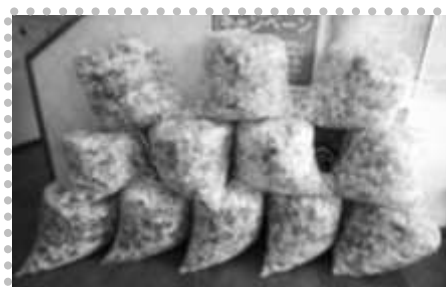
たくさんのペットボトルキャップのご協力、ありがとうございました。