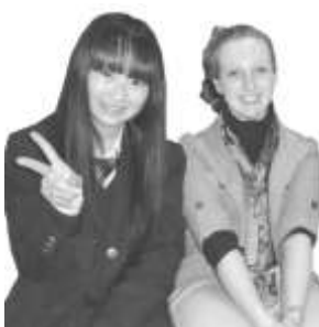
オリビアちゃんと一緒に☆