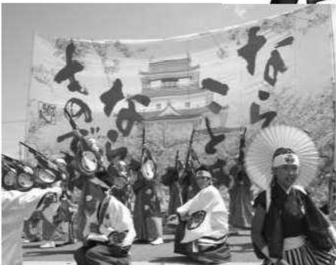
お客さんを巻き込んで、拍手喝采のステージ!