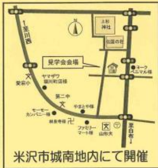
米沢市城南地内にて開催

～ 詳細はどちらも「ホームページ」もしくは前日(金)の「新聞折り込みチラシ」をご覧ください! ～