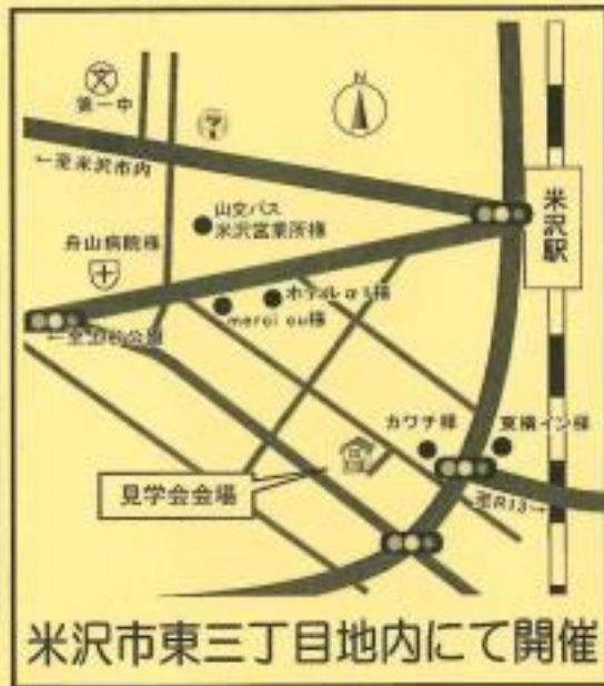
米沢市東三丁目地内にて開催